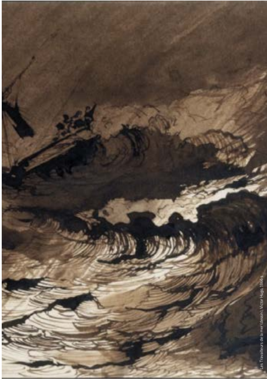
Les Travailleurs de la mer (dessin), Victor Hugo, 1866 s