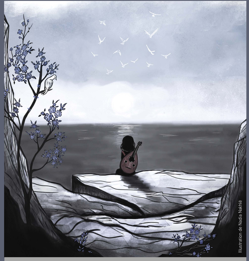
Illustration de Nadia Nakhlé

Spectacle proposé dans le cadre de la 12 e édition du Festival Transversales , consacré au thème de l'« itinérance », et en lien avec la Journée internationale des droits de l'Homme.