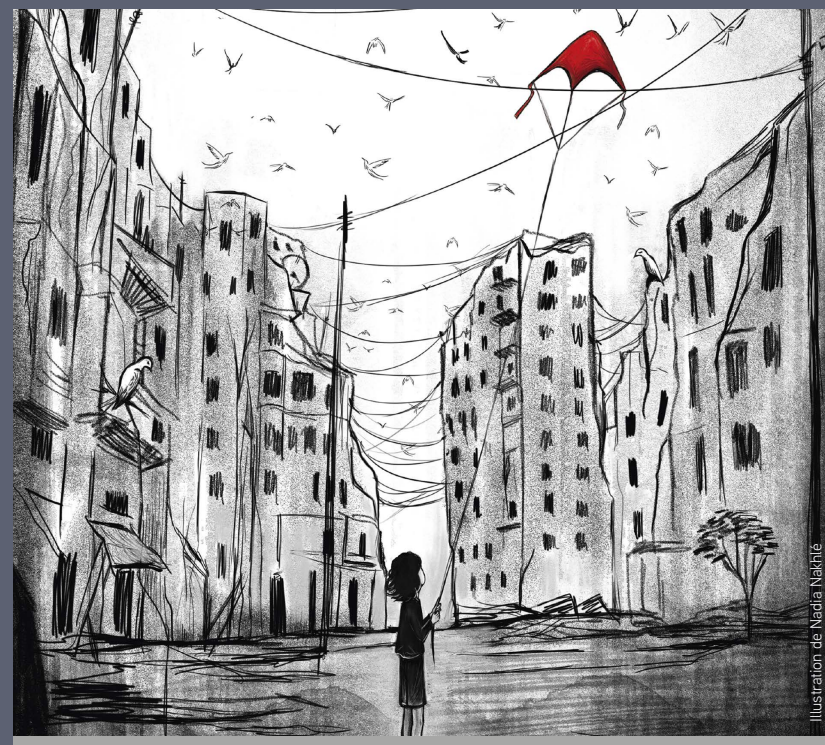
Illustration de Nadia Nakhlé

Julie. Les oiseaux ne se retournent pas est aujourd'hui adapté en une proposition artistique vivante et singulière. Il s'agit d'un BD concert où la voix des deux comédiennes se mêle aux projections animées de la bande dessinée et aux musiques de Mohamed Abozekry au oud et