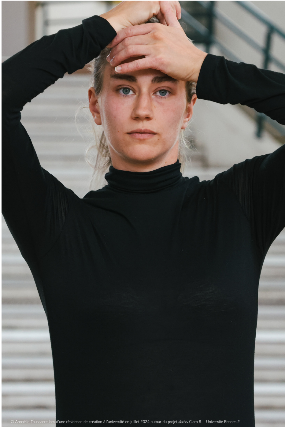
© Annaelle Toussaere lors d'une résidence de création à l'université en juillet 2024 autour du projet dorée . Clara R. - Université Rennes 2