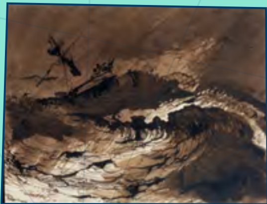
© «Le Bateau vision», Les Travailleurs de la mer (1866). Plume, pinceau, encre brune et lavis (192 x 255 mm). Victor Hugo (dessinateur). Bibliothèque nationale de France, Manuscrits, NAF 247451, fol. 111.