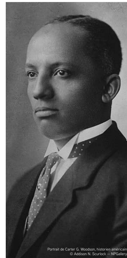
Portrait de Carter G. Woodson, historien américain